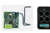
Receptor y control de llavero ECHO