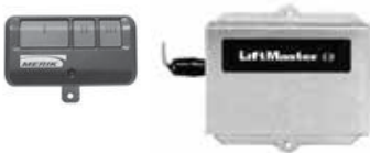
Receptor y control multi-frecuencia 893 MAX